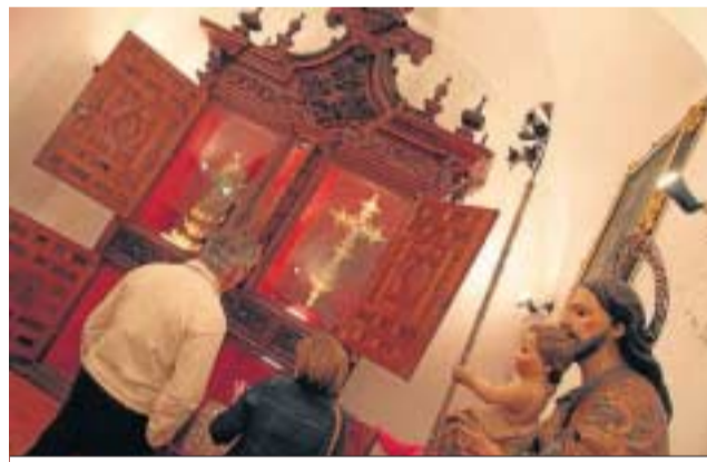
Una estampa del interior de la Colegiata de Osuna.