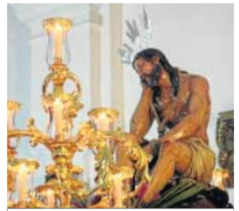
El Señor de la Humildad y Paciencia de Carmona.

mo de su riqueza monumental y artística. Así, se ha instalado un panel introductorio con información general, lugares de interés y actividades relacionadas con la fiesta. También aparecen señalizados otros puntos como talleres artesanos, iglesias con imaginería, lugares de ensayo de bandas de música, casas hermandad y museos de arte sacro, junto a los lugares que integran la Red de Espacios de Interpretación de la Semana Santa.